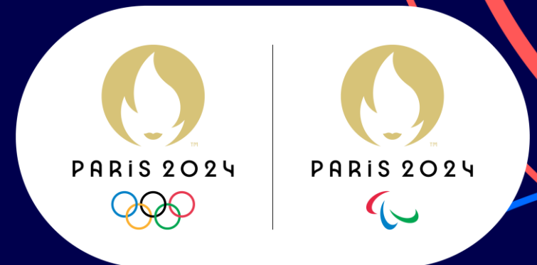
Académie Paris 2024 En cours de réalisation