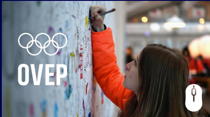
Comité International Olympique