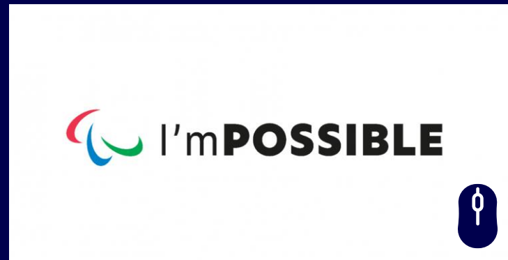
Comité International Paralympique